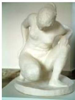
V. Makovský: Žena v lázni