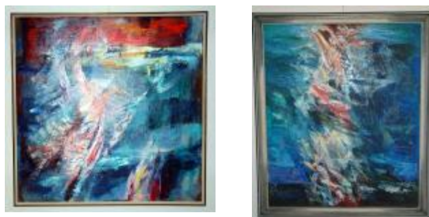
K.Haruda O -1010 O -1009

Všechny nové přírůstky do sbírek Horácké galerie byly zapsány do knihy přírůstků (1. stupeň evidence), po zpracování zapsány pod jednotlivými inventárními čísly do příslušných inventárních knih (2. stupeň evidence) - Obrazy (O), Plastiky (P), Kresby a grafika (G), Sklo (N) a Šperk (S). Ke každému přírůstku byly vypsány lokační karty, karty jednotné centrální evidence a vědecké karty.