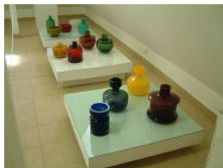
Z expozice: část původního zámeckého mobiliáře a pohledy do expozice Sklo,sklo,sklo v zámecké mansardě